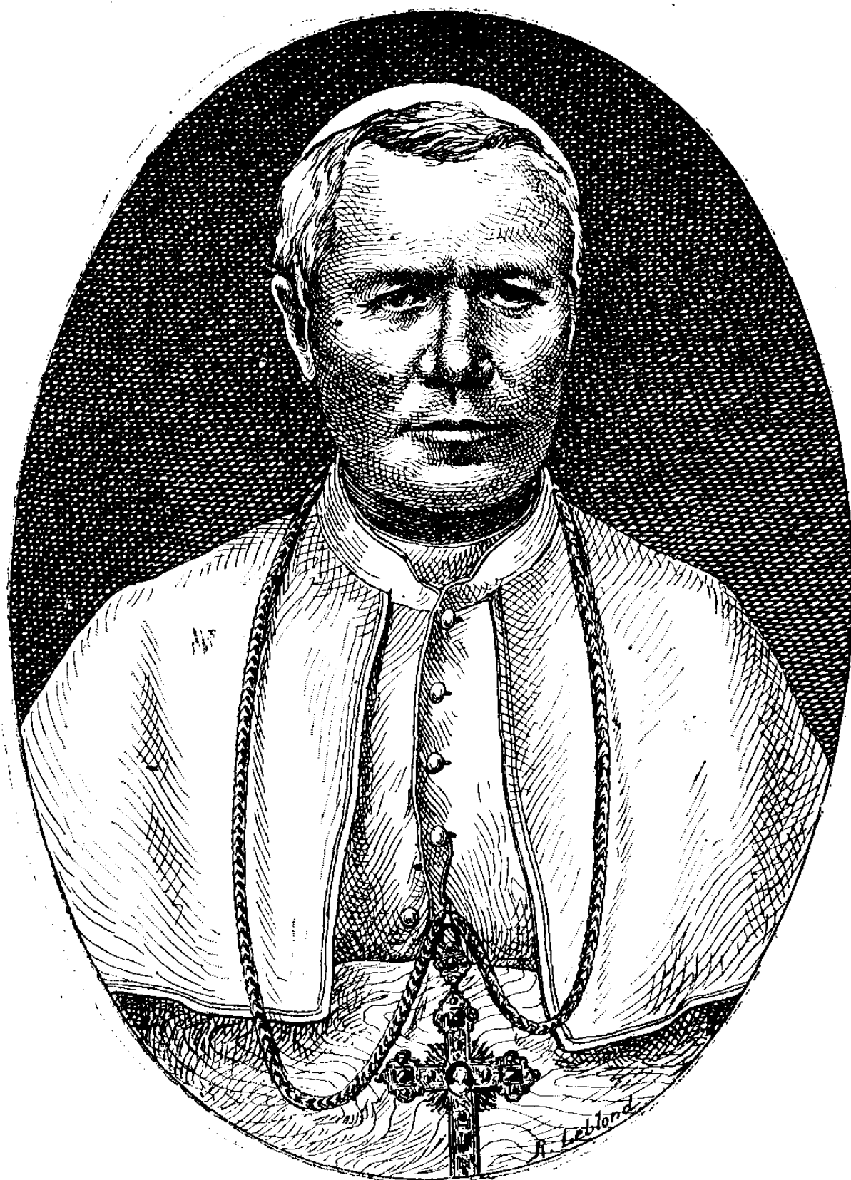
Su Santidad Pie X.